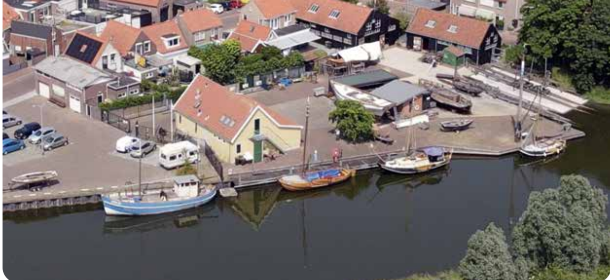
Historische Scheepswerf Meerman