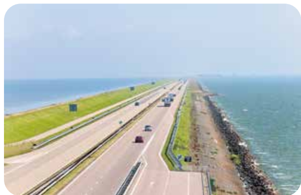
De afsluitdijk splitste in 1932 de Zuiderzee op in IJsselmeer en Waddenzee.

Bij slecht weer en hoog water stroomde de Zuiderzee met enige regelmaat over. Een beruchte overstroming is de Kerstvloed van 1717, waarbij het water tot Zwolle, Haarlem en Amsterdam kwamen er meer dan tienduizend slachtoffers vielen. Elke honderd jaar ging het wel een paar keer mis en vielen er weer slachtoffers. Daarom werd in 1886 De Zuiderzeevereniging opgericht, die moest onderzoeken of het mogelijk was om de Zuiderzee droog te leggen. Ingenieur Cornelis Lely was hier onderdeel van, en ontwierp in 1891 al het eerste plan voor de afsluiting en inpoldering van de Zuiderzee. Die plan stuitte echter op veel tegenstand, onder andere door de visserij, en werd niet direct serieus genomen. Tot er in 1916 weer een grote vloed kwam, vergelijkbaar met de kerstvloed in 1717. Toen zag men de noodzaak van dit plan wel in. Bovendien was er tekort aan landbouwgrond, wat met inpoldering opgelost kon worden. In 1919 besloot het Parlement tot het uitvoeren van de Zuiderzeewerken. In 1932 werd de 32-kilometer lange Afsluitdijk voltooid; de Zuiderzee was opgesplitst in IJsselmeer en Waddenzee.