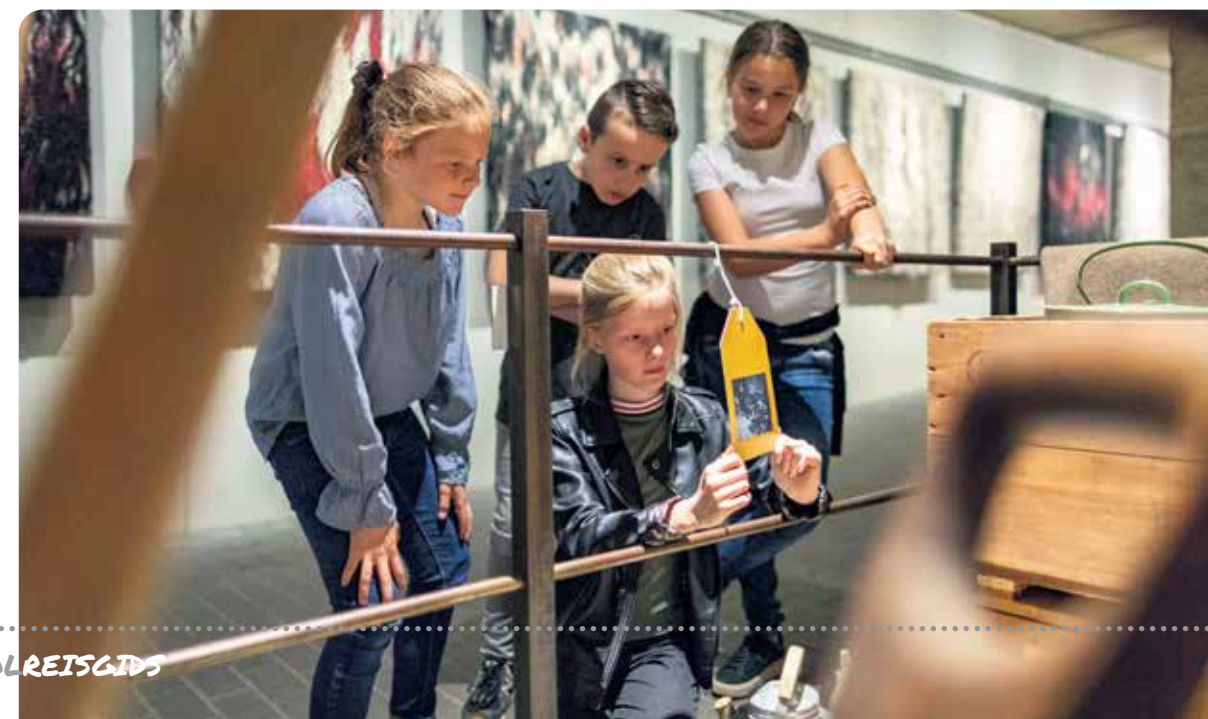
Kinderen op onderzoek in het museum