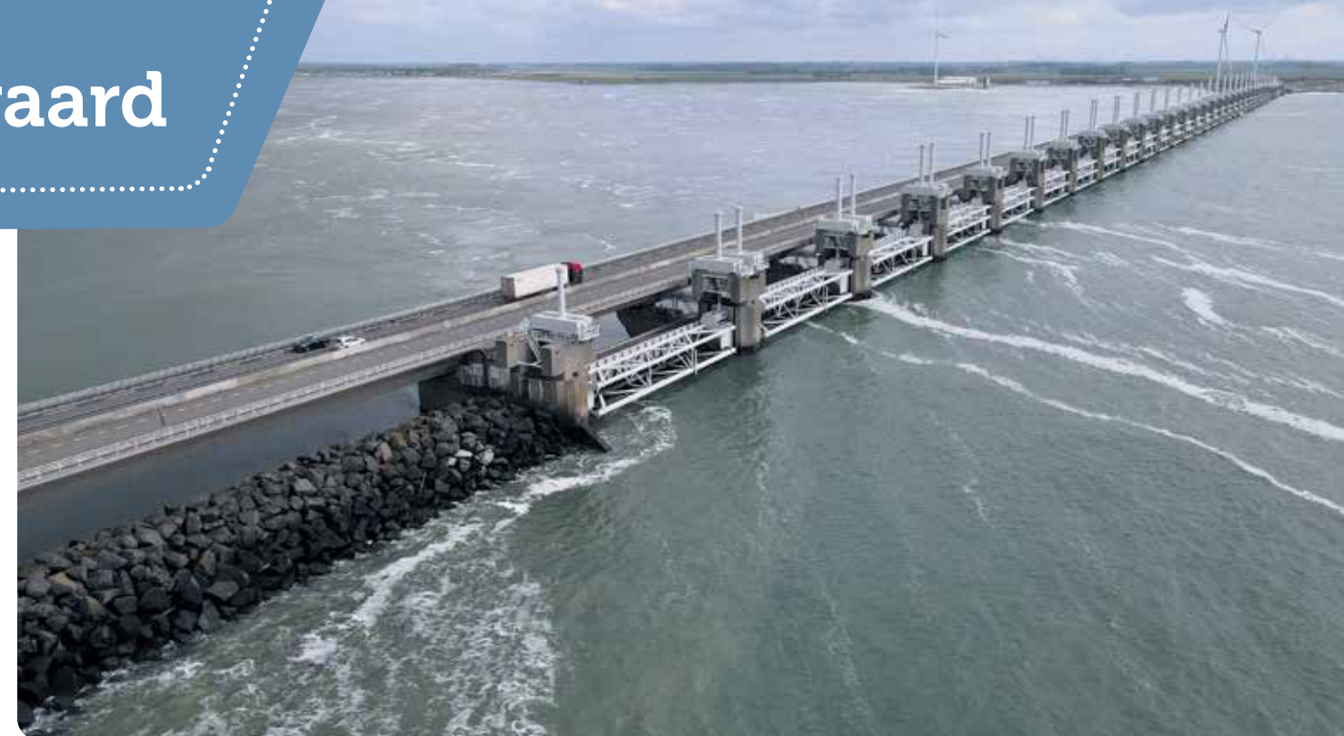
Bewonder de beroemde Deltawerken