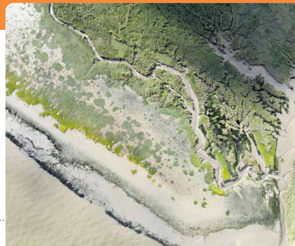
Kom wandelen in het Verdrongen Land van Saefinge