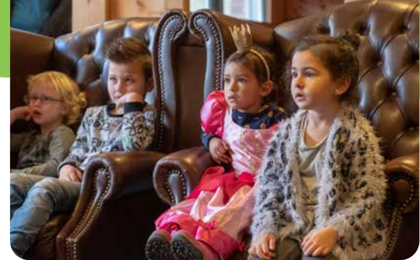
Lesprogramma Prins Willem Danst

Bij een schoolreisje naar Paleis Het Loo is er ook veel ruimte om te spelen en energie kwijt te kunnen. Direct naast het Juniorpaleis is bijvoorbeeld een