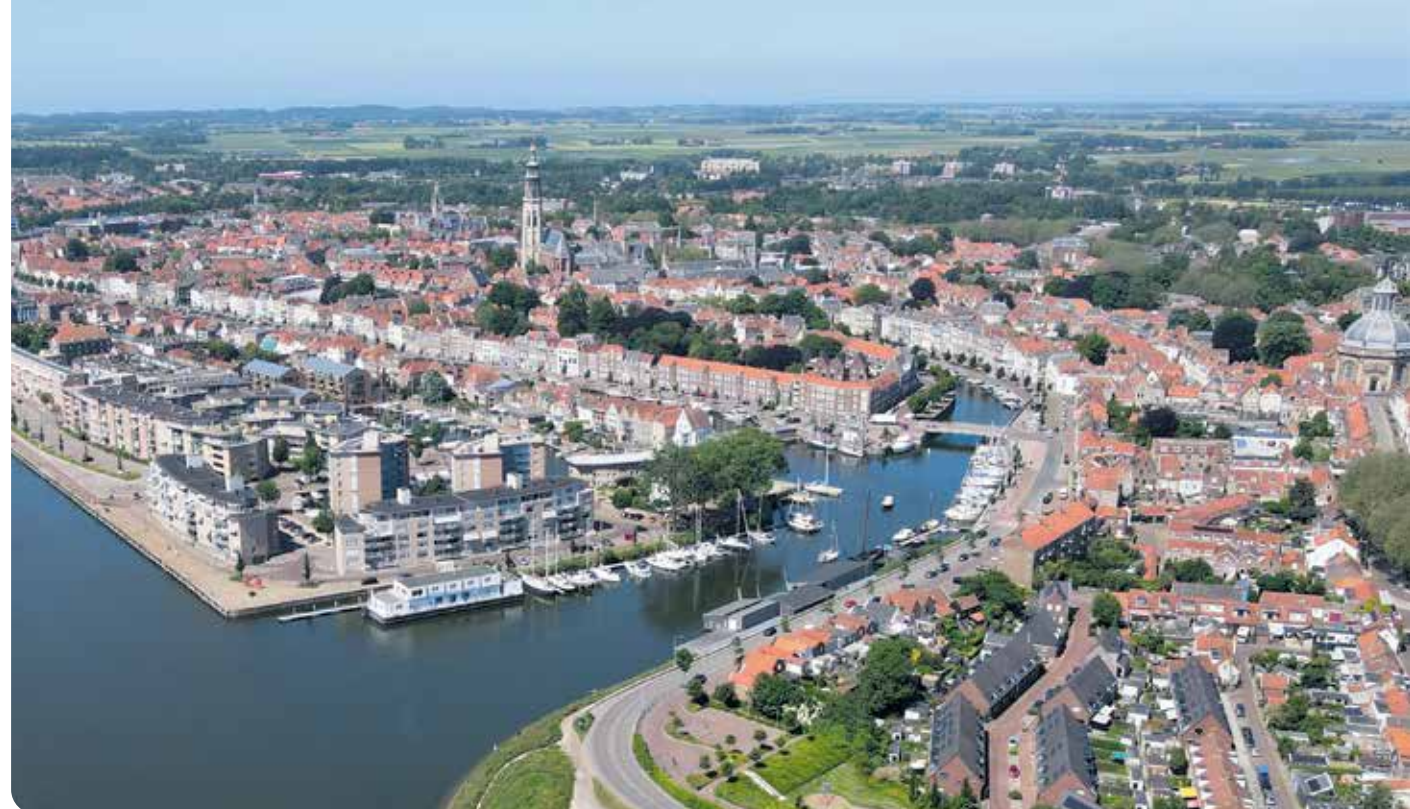
Historische binnenstad Middelburg vanuit de lucht