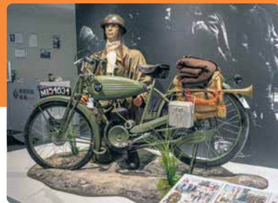
Memorial 40-45, Kapelle

Er zijn zoveel plekken in Zeeland, die bovenaan een schoolreis bucketlist kunnen komen te staan, maar deze plekken mogen zeker niet ontbreken: Het Watersnoodmuseum, het Bevrijdingsmuseum, het MuZEEum, Waterpark Neeltje Jans en Zeeuws Museum. Deze uitjes kunnen gecombineerd worden met de wat kleinere uitjes, zoals: Memorial 40-45, Kapelle, gecombineerd met de Historische Scheepswerf Meerman-Museum Arnemuiden, Het school museum in Terneuzen, de Stoomtrein Goes – Borssele of de Tropical Zoo.